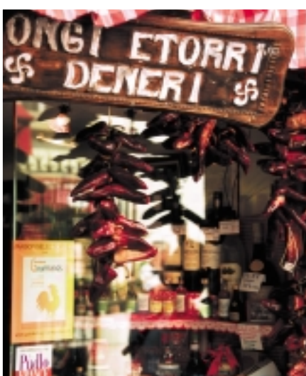
Les piments d'Espelette